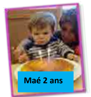
Maé 2 ans