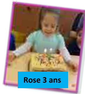
Rose 3 ans