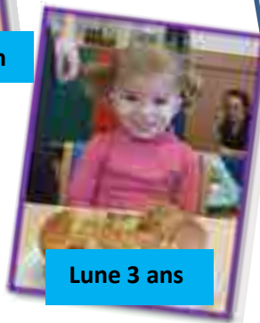
Lune 3 ans